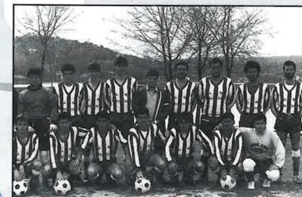
Ruidera C.F., año 1987.

EL Alcalde de Ruidera entrega una placa En reconocimiento a su labor en pro del deporte local 15 de Agosto de 1998